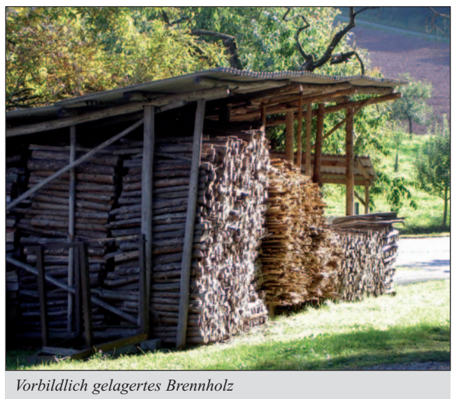
Vorbildlich gelagertes Brennholz

Anlaufstellen sind die Ansprechpartner für Holzenergie an den Ämtern für Land- und Forstwirtschaft und die Zusammenschlüsse der Waldbesitzer. Adressen hierzu finden Sie unter „ www.forst.bayern.de “.